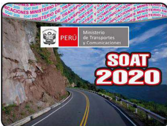
IMAGEN DEL HOLOGRAMA

Nanotexto o Microtexto de 40 mm con el texto "SOAT".